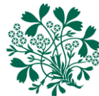
Royal Botanic Garden Edinburgh

Au nom du Jardin botanique royal d'Édimbourg